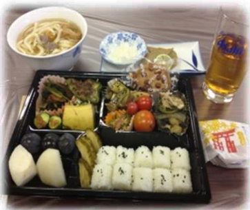
仕出し料理みたいに豪華な手作り食事!!!