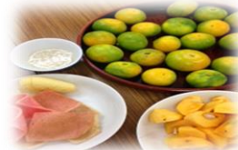
甘酒は麴から 手作り！！ 自然の甘味で 絶品！！！！