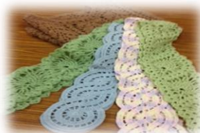
福祉まつりに展示し てもらいます！！