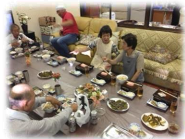
食事風景は和気あいあい農作物の出来具合を語る!