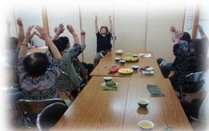
木のおいが気持ち い素敵な集会所！