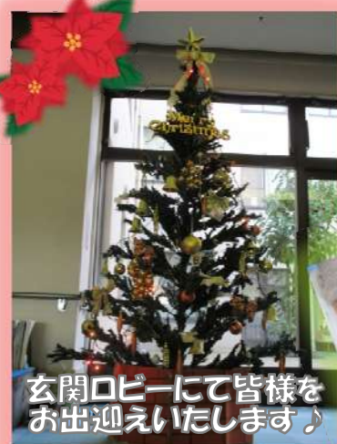
玄関ロビーにて皆様をお出迎えいたします♪

今年も利用者さんと一緒に、高井の里をクリスマスパーティーに飾り付けしました。毎年恒例のロビーのクリスマスツリーの飾り付けや今年はレモングラスを使ってクリスマスリースの制作もしました。レモンのいい香り…♪来所の際は、是非ご覧ください。